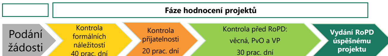
Obr. 3 - Schéma hodnocení projektů s orientační dobou hodnocení

Žádosti jsou hodnoceny v měsíčních intervalech, rozhodné je datum doručení podepsané žádosti na AOPK ČR.