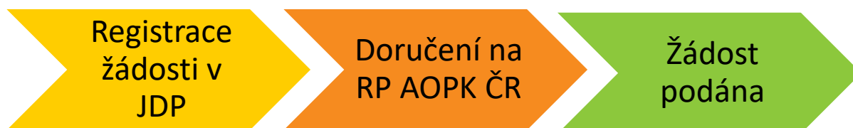
Obr. 1 – Kroky vedoucí k podání žádosti

Žadatel po registraci žádosti vygeneruje její tiskovou verzi ve formátu pdf a podepíše, čímž stvrdí čestná prohlášení a všechny skutečnosti uvedené v žádosti o dotaci. Ve lhůtě maximálně 5 pracovních dnů od registrace žádosti v JDP podepsanou tiskovou verzi žádosti (včetně všech příloh požadovaných dle kap. B.3 a příloh č. 3 a 4 této Příručky, které žadatel neuložil do JDP) doručí na AOPK ČR. Pokud je vytištěná žádost doručena osobně anebo poštou, bude žadatelem podepsána fyzicky. Žádost lze doručit i datovou schránkou (dále jen „DS“). V případě doručení žádosti e-mailem bude žádost podepsána kvalifikovaným elektronickým podpisem. Žádost je považována za podanou v momentě doručení na AOPK ČR.